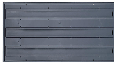
Coperchio con culle per l'impilaggio. Cover provided with channels for stacking