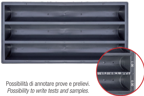
Possibilità di annotare prove e prelievi. Possibility to write tests and samples.